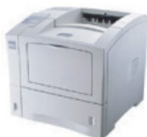
EPSON EPL-N 2050

DOCUPRINT N2125B DOCUPRINT N2125D DOCUPRINT N2125DE DOCUPRINT N2125TD