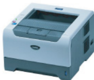
BROTHER HL 5240

DCP 8060 DCP 8065 DN HL 5240 HL 5250 DN HL 5270 DN HL 5270 DN DN2LT HL 5280 DW MFC 8460 N MFC 8460 DN MFC 8870 DW